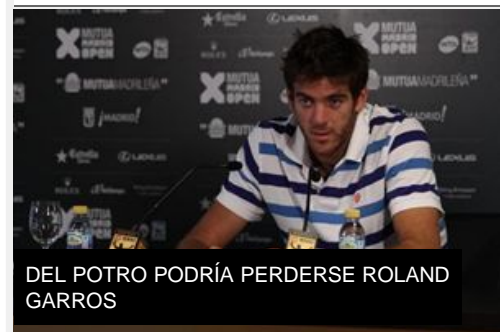
DEL POTRO PODRÍA PERDERSE ROLAND GARROS