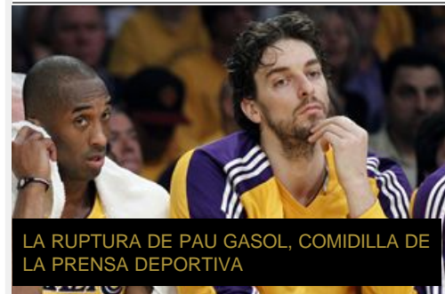
LA RUPTURA DE PAU GASOL, COMIDILLA DE LA PRENSA DEPORTIVA